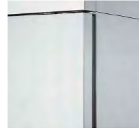
Finitions intérieures et extérieures entièrement en acier inoxydable qui facilitent le nettoyage et garantissent une parfaite hygiène du produit stocké.