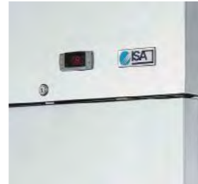
Centrale électronique pour le réglage automatique de la température.