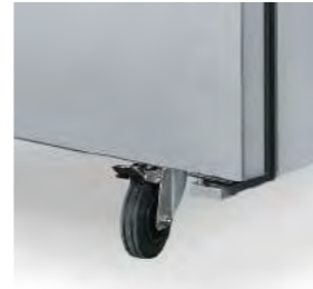
Roues pour un déplacement aisé.