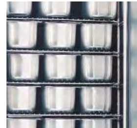
5 étagères fournies réglables en hauteur. Possibilité de poser 5 étagères supplémentaires, portant à 11 le nombre de niveaux de charge.