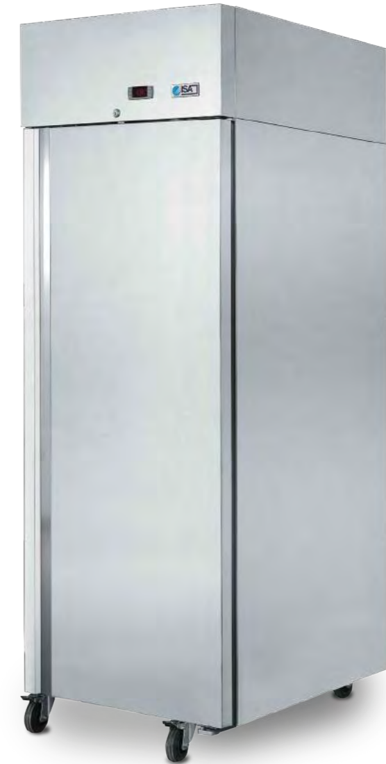
LABOR 70 RS RV TB