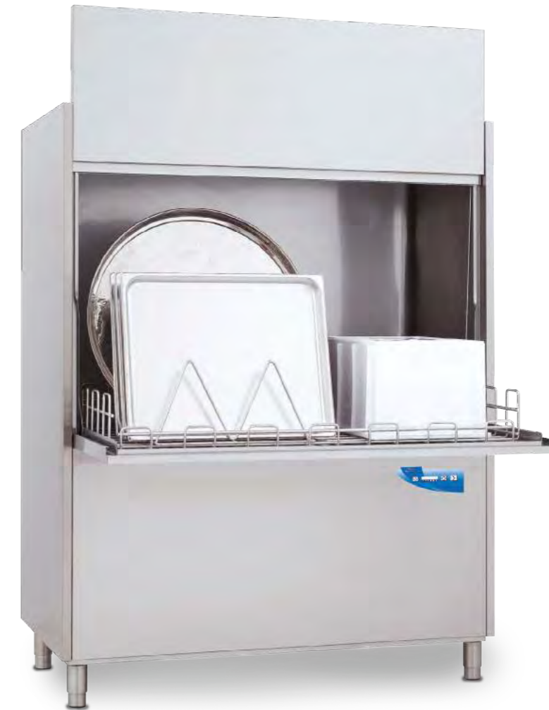
RIVER XP 298