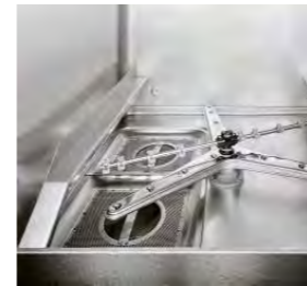
Filtre intégral du réservoir en acier inoxydable AISI 304 favorisant la propreté de l'eau.