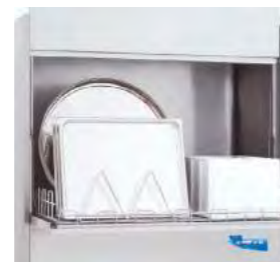
Permet de laver des plateaux de pâtisserie 40x60 cm (accessoire en option).