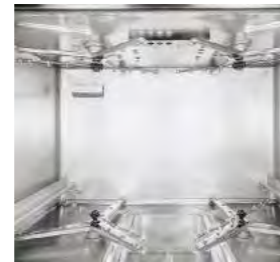
Champs de lavage et rinçage indépendants fabriqués en acier inoxydable.