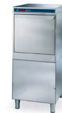
LP 1 S5 PLUS