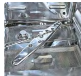
Bras de lavage et de rinçage indépendants et tournants pour que l'eau atteigne tous les ustensiles.