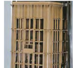
Le modèle LO 1/S800 permet le lavage d'objets de 820 mm de haut.