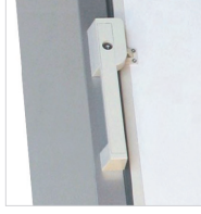
Poignée avec serrure et clé.