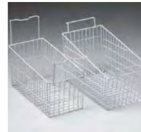
Panier pour une meilleure présentation du produit. (en option)