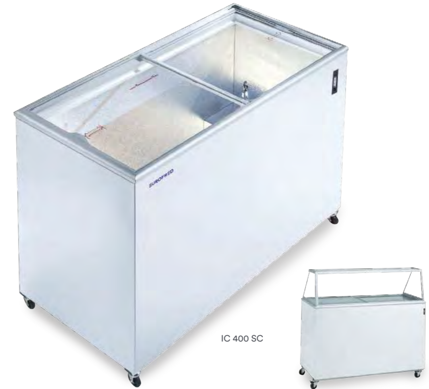
IC 400 SC