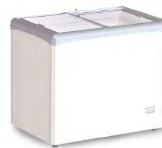
VIC 220 CSV