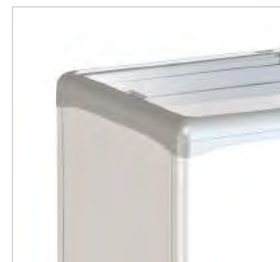
Possibilité d'incorporer des paniers pour une meilleure présentation du produit (en option).