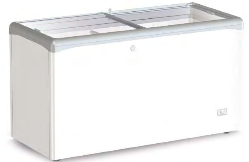
VIC 440 CSV