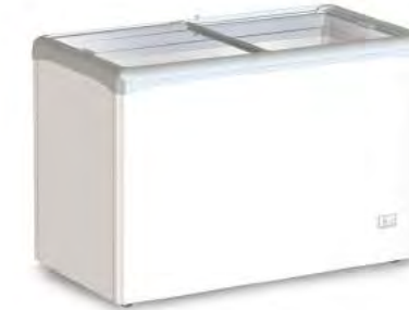
VIC 330 CSV