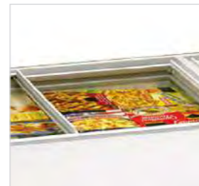
Intérieur et extérieur en tôle galvanisée avec revêtement en PVC blanc.