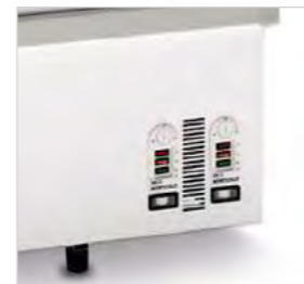
Un thermomètre lit la température intérieure.