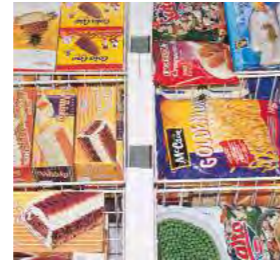
Possibilité de placer des paniers avec des supports pour produits emballés.