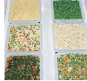
Possibilité de placer des bacs avec des supports pour produits en vrac.