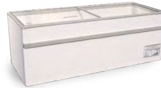
GAMME 150 « O »