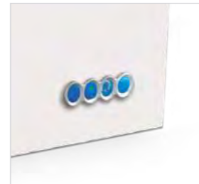
Tableaux de commande avec thermostat et thermomètre. Les modèles 200 et 250 incluent 2 thermomètres.