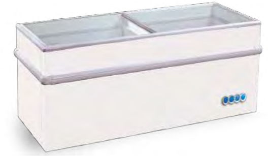
GAMME 150 « N »