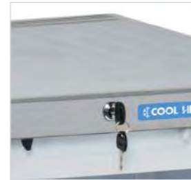
Serrure de série.