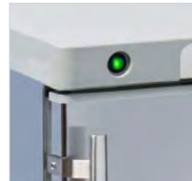
Modèles RCX et RNX avec finitions en acier inoxydable.