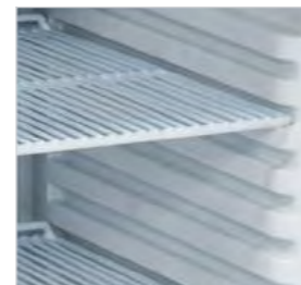
Étagères réglables pour les modèles RC/RCX200 et fixes pour les modèles RN/RNX200.