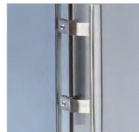
Porte réversible sur tous les modèles.