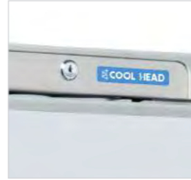
Serrure de série.