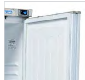
Porte réversible sur tous les modèles.