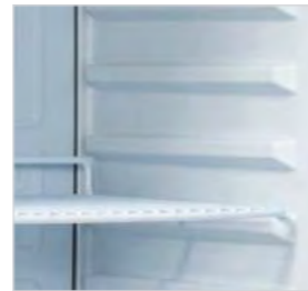
Étagères réglables pour les modèles RC/RCX 400 et fixes pour les modèles RN/RNX 400.