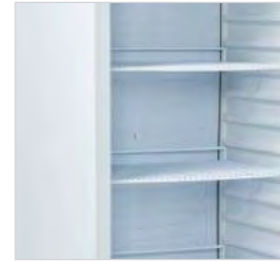
Modèles RCX et RNX avec finitions en acier inoxydable.