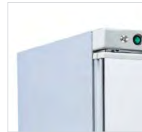
Armoire en acier inoxydable (RCX et RNX).