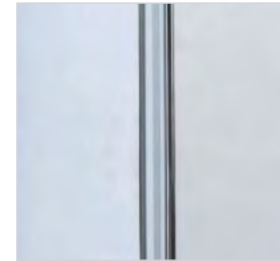
Poignée incorporée à la partie latérale de la porte.