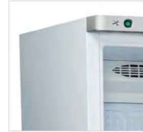
Extérieur blanc pour les modèles RC et RN.