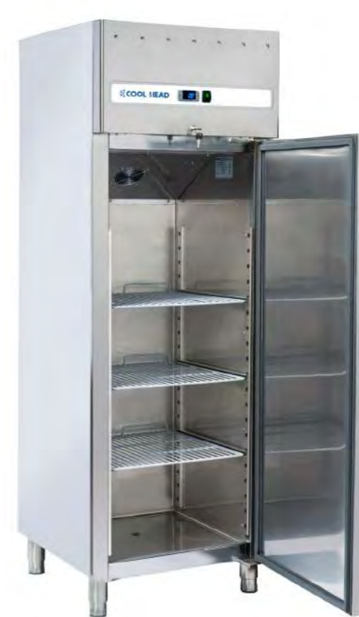
SNACK 400 TN