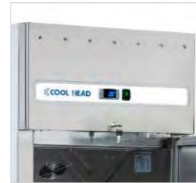
Structure interne et externe en acier inoxydable.