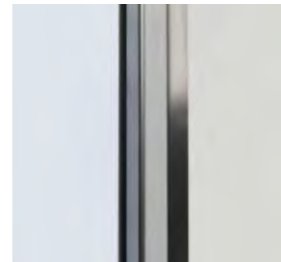
Angles arrondis pour un nettoyage plus facile.