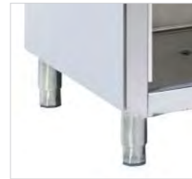
Pieds réglables en hauteur.