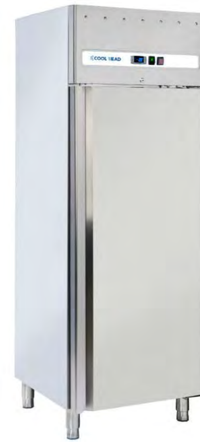
SNACK 400 BT