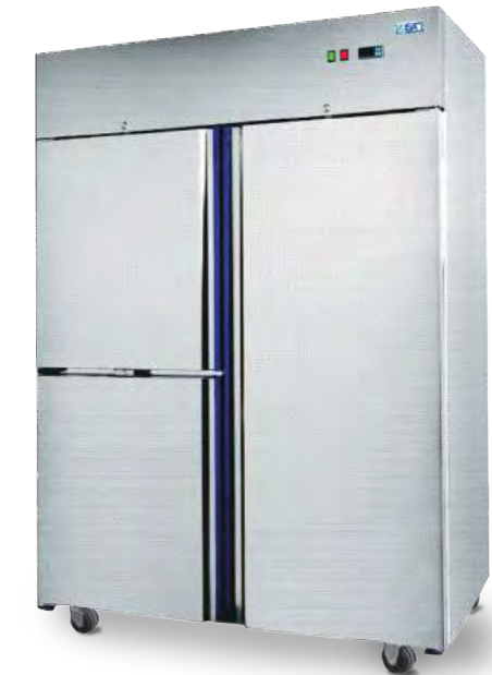
GE 1400 (1 porte + 2 1/2 portes)