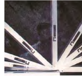
Ouverture de la porte à 180° avec retenue à 90°. Portes réversibles.