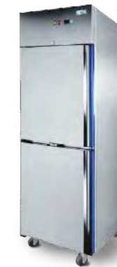
GE 700 (2 1/2 portes)