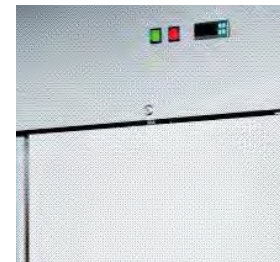
Panneau de commande électronique.