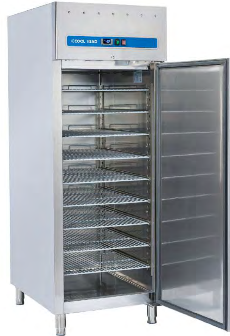
GELATO 800 BT