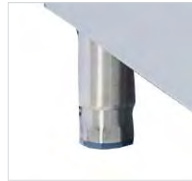
Pieds réglables en hauteur.