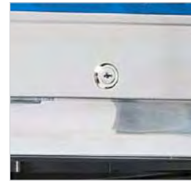
Serrure de série