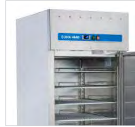
Structure interne et externe en acier inoxydable.