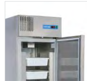
Structure interne et externe en acier inoxydable.