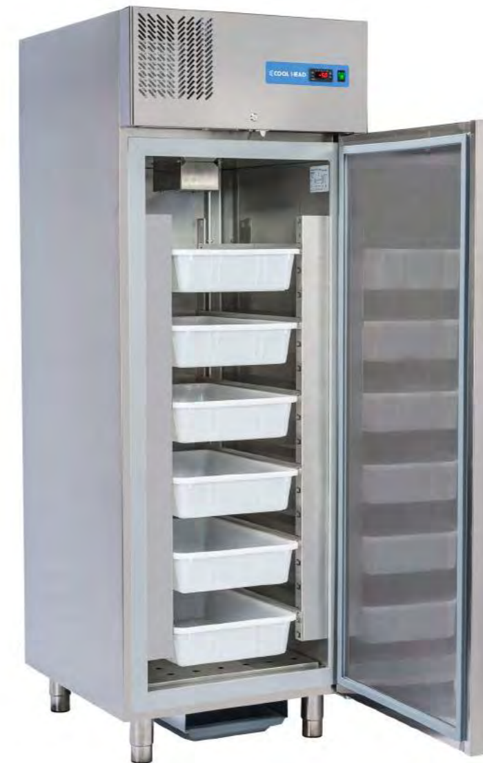
RC 700 FISH