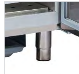
Pieds réglables en hauteur.