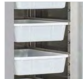
Angles arrondis pour un nettoyage plus facile.