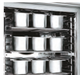
Kit de glacier en acier inox pour applications de glacier.