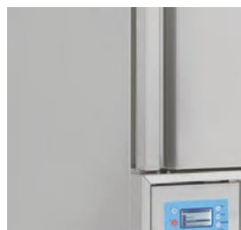
Structure interne et externe en acier inox avec coins arrondis.