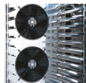
Guides préparés pour la gastronomie et la pâtisserie.