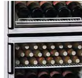
Portes avec ouverture réversible.