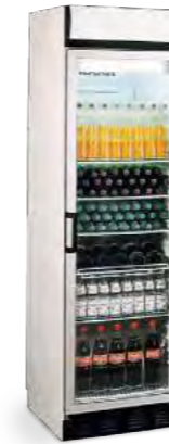
FKG 410 (ÉCRAN)