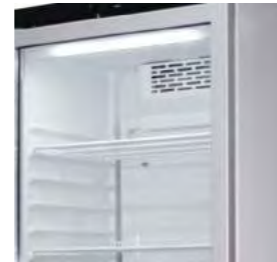
Éclairage LED de série sur tous les modèles.