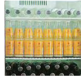
Réfrigération statique avec turbine de ventilation.