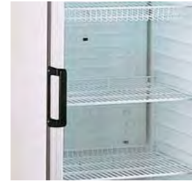
Étagères métalliques plastifiées réglables en hauteur.