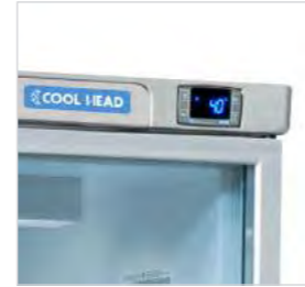
Thermostat numérique de série.