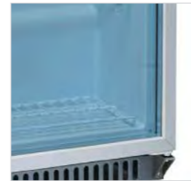
Double vitrage trempé.