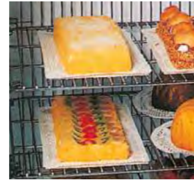
Étagères grille métallique sur tous les modèles. Réglables en hauteur sur les armoires ventilées et fixes sur les armoires statiques BT.