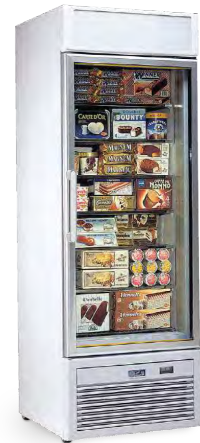
TORNADO S40 BT