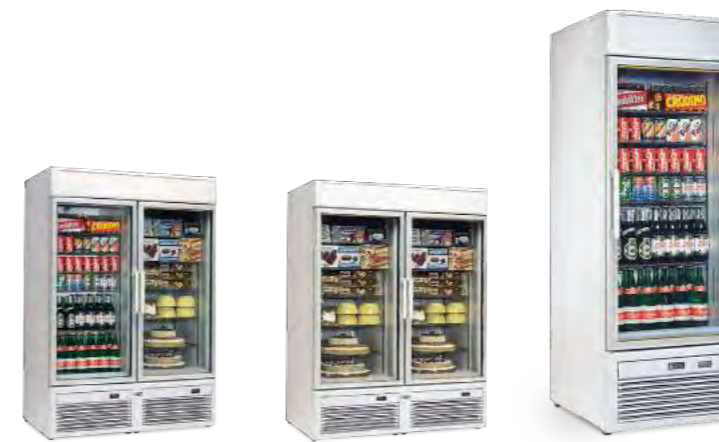
TORNADO V 100 TN-BT