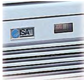
Thermomètre indicateur de la température intérieure.