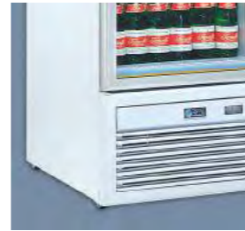
4 roues et 2 pieds stabilisateurs.