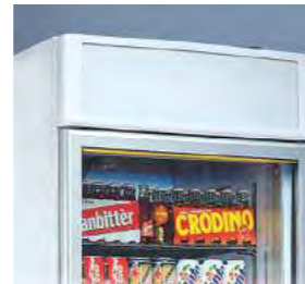
Écran lumineux personnalisable.