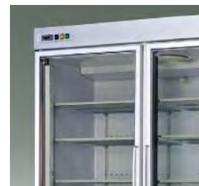
Cadres aux dimensions réduites pour augmenter la surface vitrée.