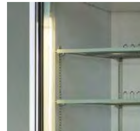
Éclairage LED sur chaque côté de la porte pour rehausser la visibilité du produit.