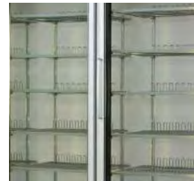
5 étagères par porte.