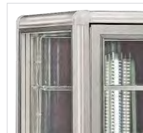
Modèles couleur argentée.