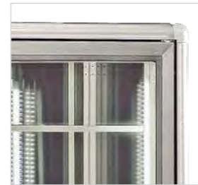
Structure en aluminium résistant à la corrosion.