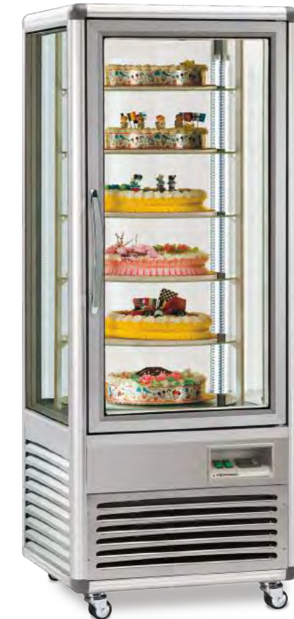
SNELLE 505 R NEW