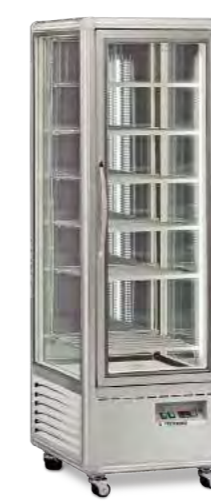
SNELLE 400 GBT NEW