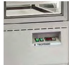
Panneau de commande électronique.