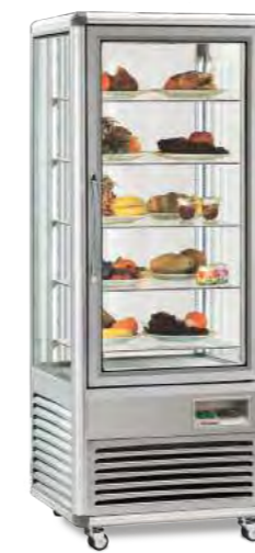
SNELLE 505 Q NEW