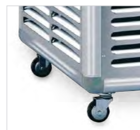
Roues incluses (hauteur de la roue : 85 mm).