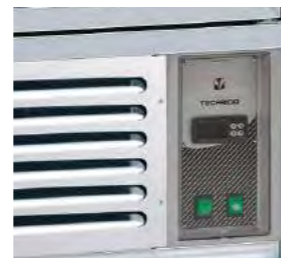
Contrôle des commandes avec : - thermostat - thermomètre