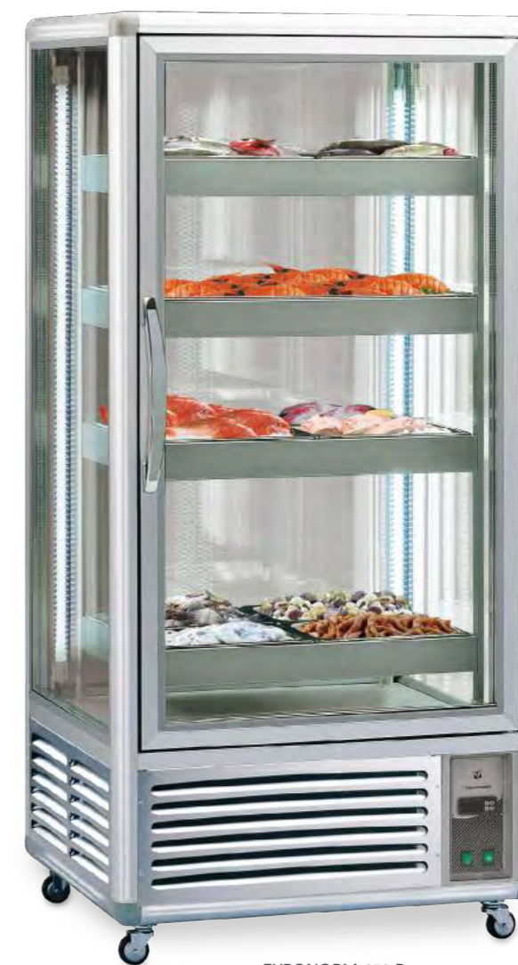
EXPONORM 650 P