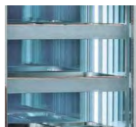
Éclairage intérieur par LED.