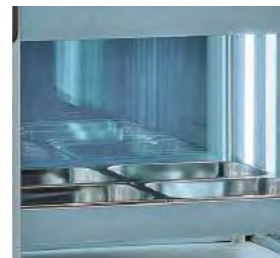
Incorporent les profilés pour placer des bacs Gastronorm GN 2/1, GN 1/1 ou GN 1/2.