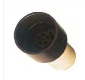
Filtre à charbon actif.