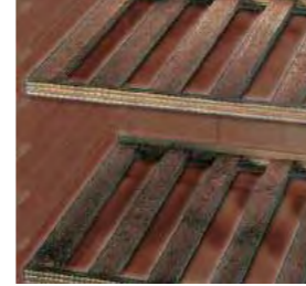
Étagères en bois réglables en hauteur.