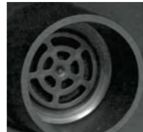
Filtre de charbons actifs nettoyant l'air et évitant l'entrée d'impuretés altérant le vin.