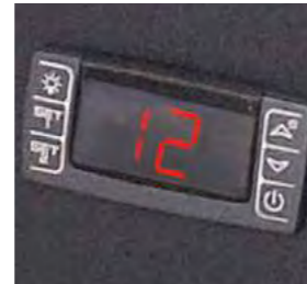
Thermostat de réglage de la température avec écran numérique. Après avoir défini la température, le réglage se fait de manière électronique.