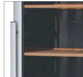
Porte réversible et éclairage intérieur.