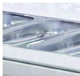
Plateau intérieur embouti pour bacs GN 1/3 hauteur 40 mm fourni.