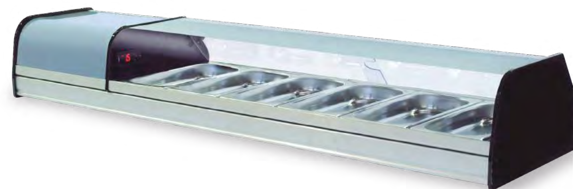
CITY 6 SUSHI