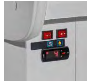
Panneau de commande avec thermostat.