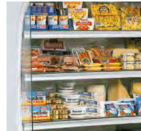
Étagères réglables en hauteur.