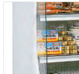
Panneaux latéraux partiellement en verre pour une meilleure visibilité.