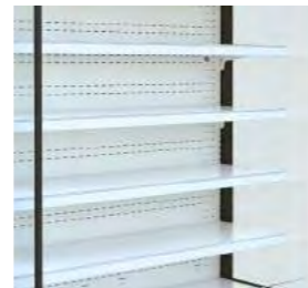
Quatre étagères de 36 cm de profondeur.