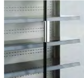
Portes avec double vitrage.