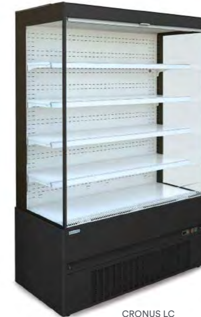
CRONUS LC (laqué)