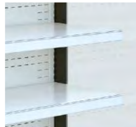
Profils porte-prix transparents en PVC.