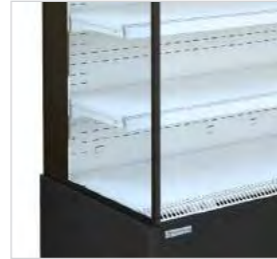
Côté panoramique pour une vision panoramique des produits exposés.