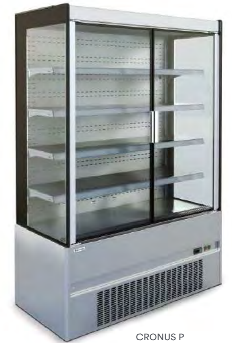
CRONUS P (inox)