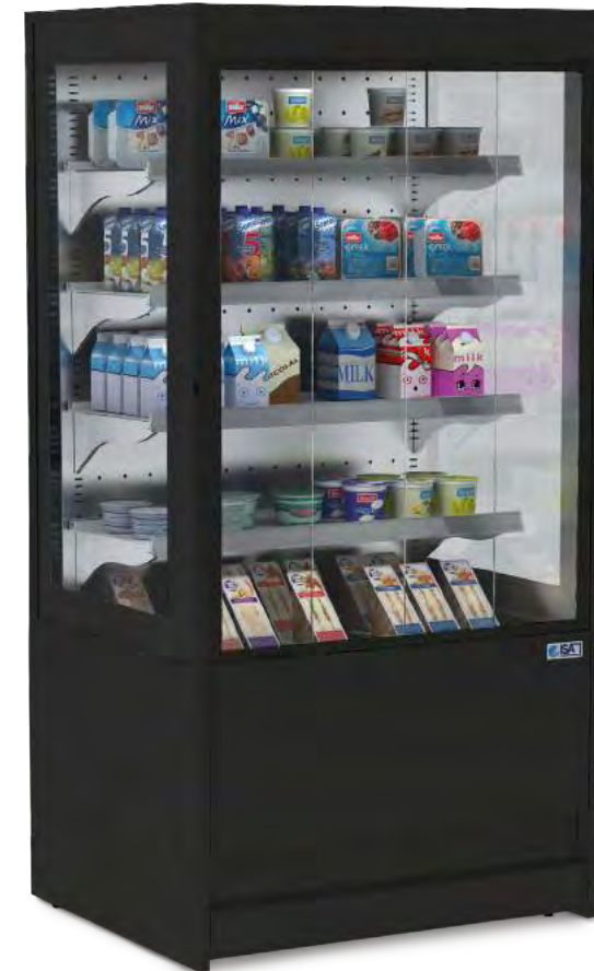
MULTIVIEW avec portes Smart Flex (sur commande)