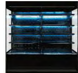
Système automatique d'évaporation de l'eau de condensation.