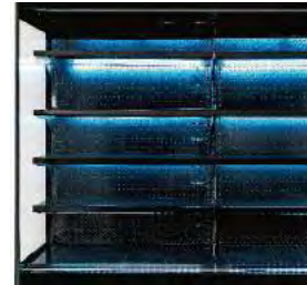
Panneaux latéraux totalement panoramiques dotés d'une large surface vitrée.