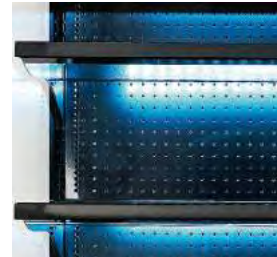
Étagères réglables de 45 cm pour une grande surface d'exposition.