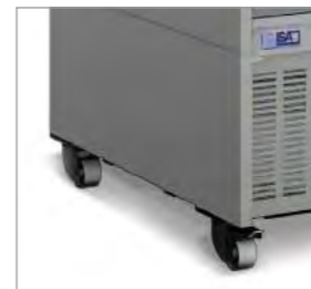
Base dotée de roues en option.