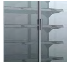
5 étagères de 40 cm de profondeur.