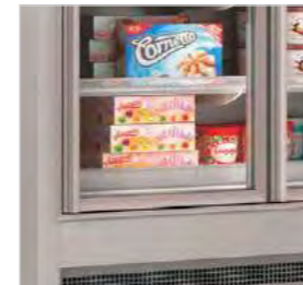
Vitrine murale de congélation idéale pour la conservation à basse température.