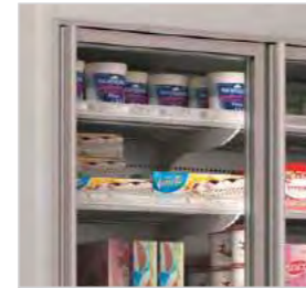
Portes en verre double vitrage.