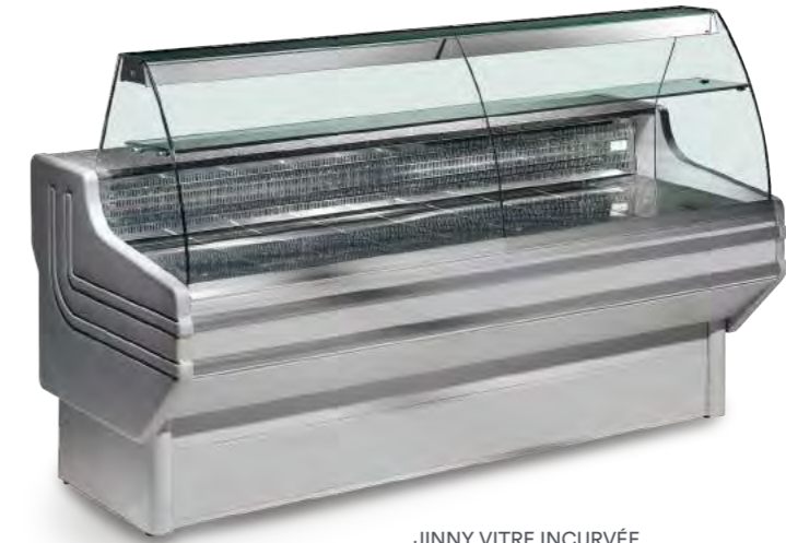
JINNY VITRE INCURVÉE (vitre intermédiaire sur commande)