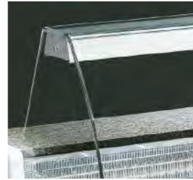
Éclairage intérieur par néon.