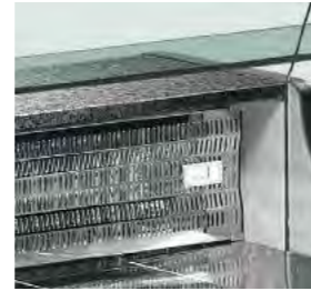
Surface d'exposition en acier inoxydable (profondeur 66,5 cm).