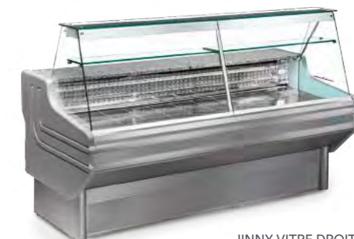
JINNY VITRE DROITE