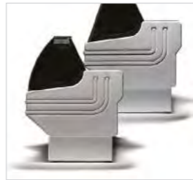
Panneaux latéraux en ABS thermoformé.