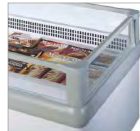
Profilé de protection anti-choc de couleur grise.