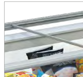
Couvercles en verre double vitrage.