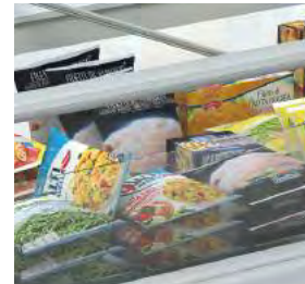
Grande surface vitrée pour une visibilité optimale du produit exposé.