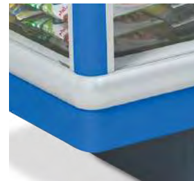
Profilé de protection anti-choc de couleur grise.

VITRINES HORIZONTALES GONDOLE AVEC PORTES