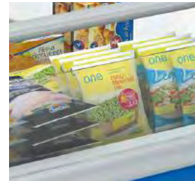
Idéal pour le merchandising.