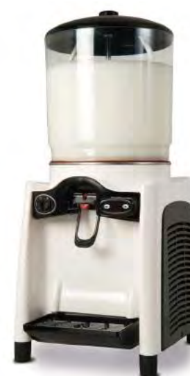
DRINK MAGIC 12