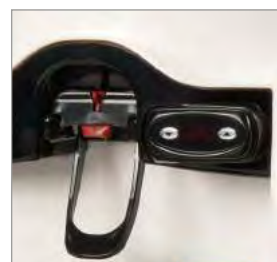
Commande électronique intégrée pour le réglage de la température du produit dans le réservoir.