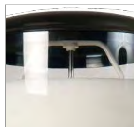
Pales de l'agitateur.