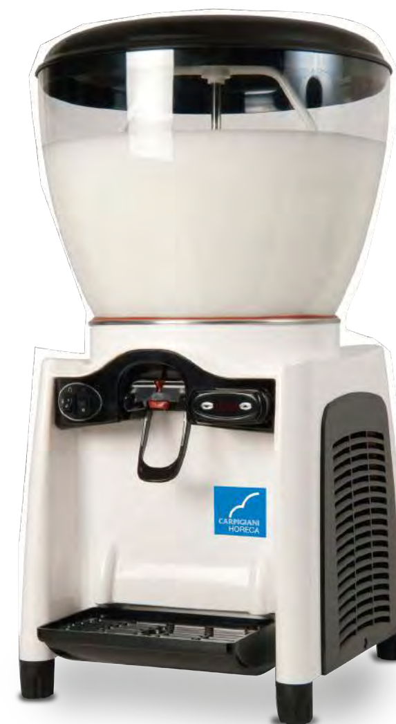
DRINK MAGIC 20