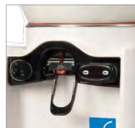
Robinet d'extraction du produit.