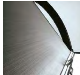
HYGIËNIQUE Persienne avec fermeture à enroulement automatique escamotable.