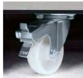
FACILE Roues cachées totalement intégrées au châssis.