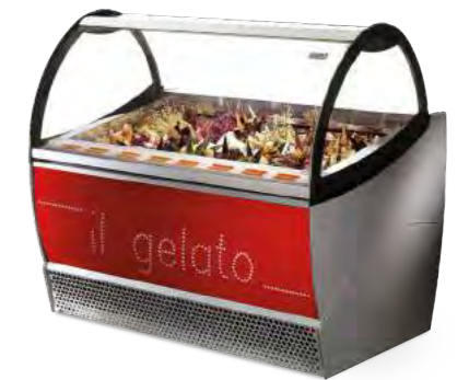
NEW MILLENNIUM (vitre incurvée)