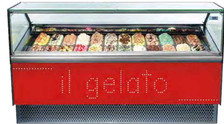
NEW MILLENNIUM SP-STD 24 (vitre droite)