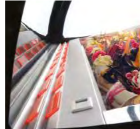
PRATIQUE Indicateur de saveurs incorporé sur le profil de la vitrine.