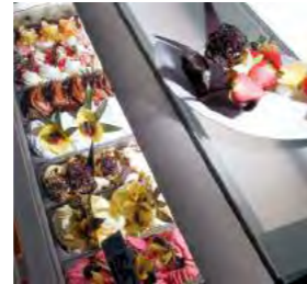
FONCTIONNEL Plateau porte-objets.