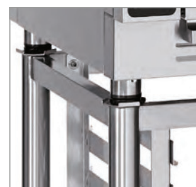
Pieds réglables en hauteur.