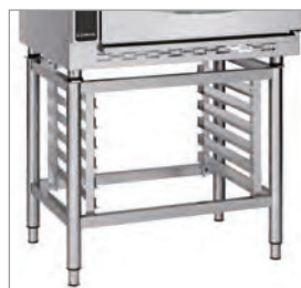
Supports de 5 ou 10 plateaux.