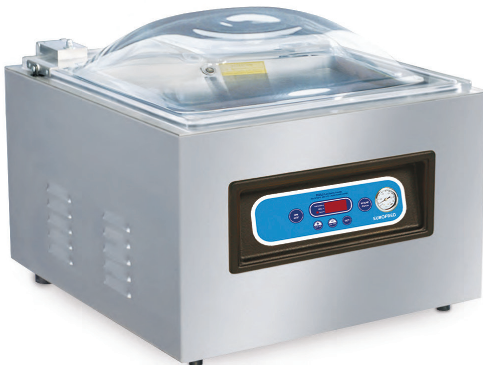
ECO 50 DIGIT