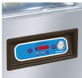
Panneau de commande numérique avec 6 programmes mémorisables.