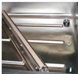
Cuve moulée sans soudures. Il est possible de retirer la barre pour faciliter le nettoyage.