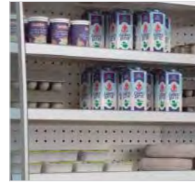
5 étagères de série de 30 cm de profondeur.