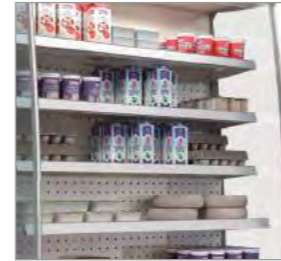
Panneaux latéraux panoramiques pour une meilleure présentation du produit.