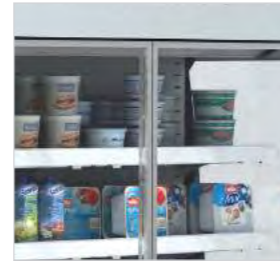
Modèles GD avec porte en verre double vitrage.