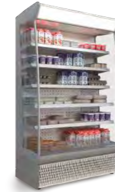
SLIM (sans portes)