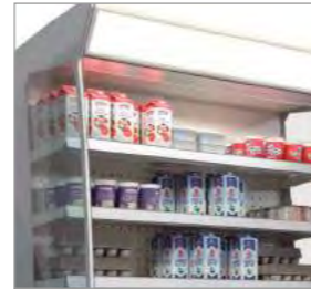
Éclairage supérieur sur tous les modèles sans portes.