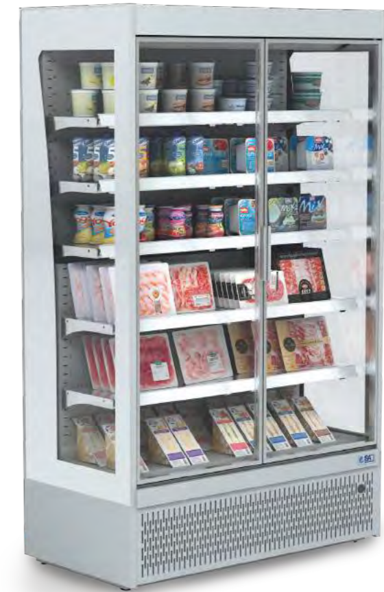
SLIM GD (avec portes)