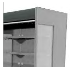
Panneaux latéraux panoramiques.