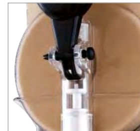
Levier facile à utiliser, à monter et à démonter.