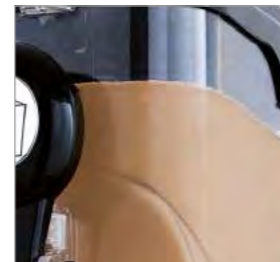
Grande capacité de production de chaque réservoir (12 l).