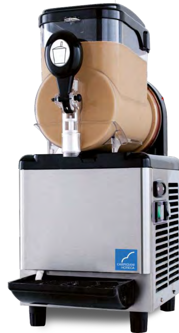
GRANISMART 5 x 1