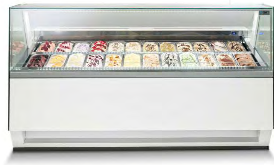
DIVA 120 H120