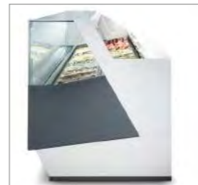
Éclairage LED décoratif au pied.