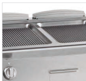
Plaque nervurée en fer.