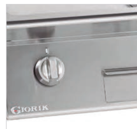
Panneaux de commandes inclinés vers l'opérateur.