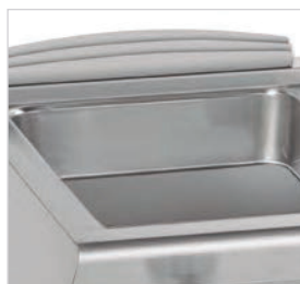
Cuves avec angles et bords arrondis en mesure d'accueillir les bacs GN 1/1 + 1/3.