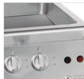
Voyants lumineux pour vérifier le bon fonctionnement de l'appareil.