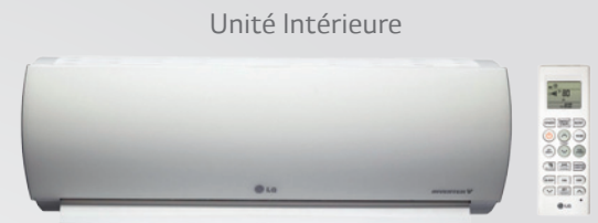
H09AK.NSM / H12AK.NSM

* Calcul conforme à la directive Européenne ERP / ** Valeurs données à titre indicatif. La pose et la section des câbles et des conducteurs sont soumises à la norme NF C15-100 ainsi qu'aux préconisations du manuel technique du constructeur.