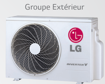
H09AK.UL2 / H12AK.UL2