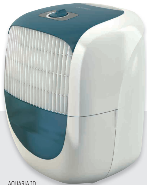
AQUARIA 10 Cod. 01298