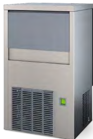
Différentes dimensions de glaçons. De 14 grammes à 41 grammes.

Cette machine à glace produit des glaçons solides et purs en forme de cubes. Le glaçon est nécessaire dans les restaurants, les hôtels et les discothèques.